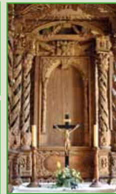
Bilder: Teehaus am Nöbdenitzer Teich, Hängebrücke am Wanderweg, Altar in Posterstein