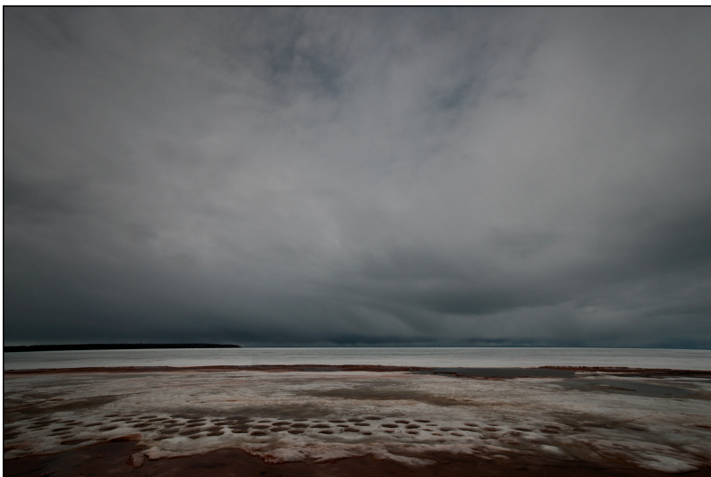
Ulrich Fischer: Lake Superior, #14/07/3, 2014

In der Sonderausstellung "Die Ferne & die Nähe" im Museum Burg Posterstein nimmt der Thüringer Fotograf Ulrich Fischer den Besucher mit auf ausgedehnte Reisen in die Vereinigten Staaten von Amerika, aber auch in unsere nähere Umgebung. Fischer beschäftigt sich seit über 40 Jahren mit der Kunst, außergewöhnliche Momente auf Fotos festzuhalten. Er lebt und arbeitet heute freiberuflich in Grümpen, Landkreis Sonneberg.