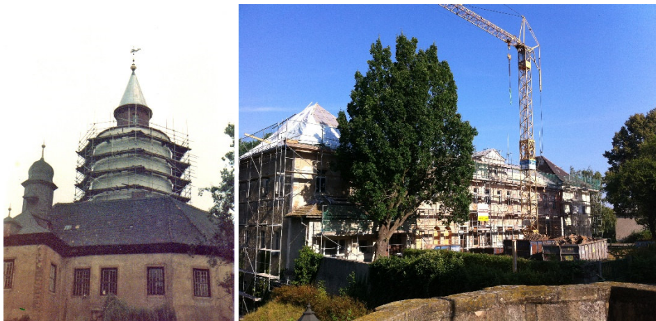
BU: Restaurierung der Burg auf einem Foto von 1984, Restaurierung des Herrenhauses 2016.

Im zweiten Ausstellungsteil dreht sich alles um den Bau der Burg und des Ritterguts. Die Sonderschau erzählt, wie die Burg Posterstein im Lauf der Zeit von der Verteidigungsanlage zum Wohnschloss und später zum Museum umgebaut wurde. Jede Generation Burgbesitzer hat das Gebäude an die eigenen Bedürfnisse angepasst. Highlights der neuen Ausstellung sind ein Tastmodell der Burg sowie ein moderner Film mit 3D-Rekonstruktionen zu unterschiedlichen Phasen der Baugeschichte. Diese basieren auf archäologischen Funden und historischen Ansichten. Fundstücke aus der Ruine des historischen Nordflügels der Burg (Festsaal-Flügel) und von der Restaurierung in den 1980er Jahren zeugen von den Veränderungen im Lauf der Zeit. Zahlreiche Fotos dokumentieren, wie sich der Postersteiner Burgberg in den vergangenen Jahren verändert hat.