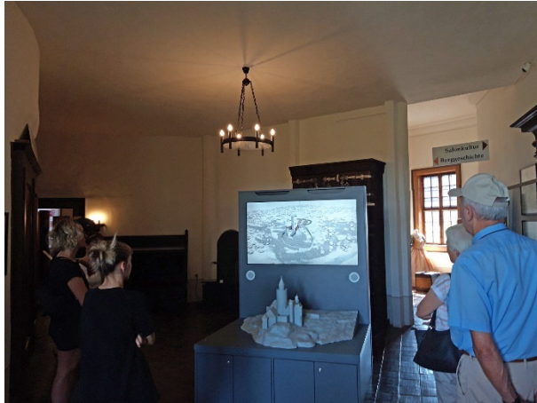
BU: Ein Highlight der neuen Ausstellung: Das Burgmodell und ein Film mit 3D-Rekonstruktionen (Museum Burg Posterstein)