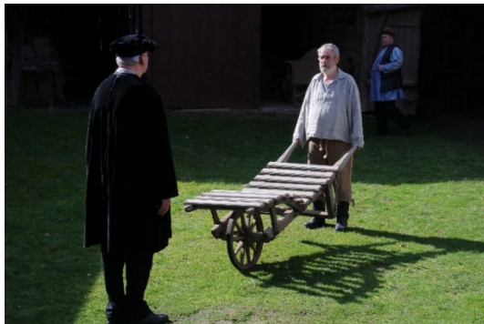
Bild: Filmdreh mit Darstellern vom Traditionsvereins Altenburger Prinzenraub e.V. auf einem Postersteiner Bauernhof

Seit dem 16. Jahrhundert wurden professionelle Advokaten angestellt. Ihnen zur Seite standen die Laienrichter und Schöffen aus der Dorfgemeinschaft. Folter als Mittel der Beweisaufnahme war üblich. Diese so genannte „peinliche Befragung“ durfte jedoch nur angewendet werden, wenn ausreichend Indizien für die Täterschaft vorlagen.