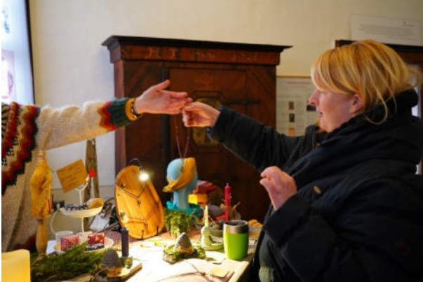
Bild: Advent im Salon am dritten Advent in der ganzen Burg Posterstein.

In stimmungsvoller Atmosphäre gibt es in der gesamten Burg Posterstein geschmackvolle Kleinigkeiten zur Weihnachtszeit. Dazu Märchen, Musik, Unterhaltung und Leckereien aus Küche und Backstube für die ganze Familie. Beim gemeinsamen Weihnachtsbasteln, bei leckerem Gebäck und Heißgetränken kommt man ins Gespräch.