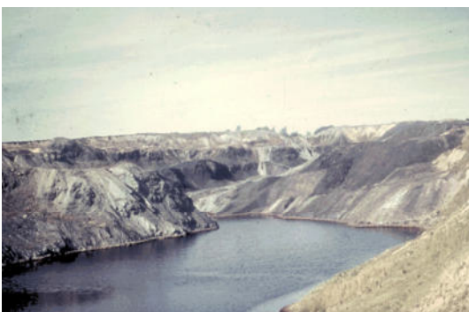
Foto 2: Tagebau Stolzenberg, nahe Autobahnabfahrt A 4, Ronneburg, 1960er Jahre

Die persönlichen Erinnerungen sind wertvoll für die Museumsarbeit. Das Museum Burg Posterstein lädt Bürgerinnen und Bürger der umliegenden Dörfer ein, ihre Erinnerungen an die Wismut zu schildern. Wie erlebten Sie die Wismut? Dafür muss man nicht zwingend selbst unter Tage gearbeitet haben, auch Angehörige, Büroangestellte und Außenstehende dürfen zu Wort kommen. Im Zeitzeugen-Gespräch am 18. März 2026, 18 Uhr, im Café „Zur eisernen Bank“ geht es um ihre persönlichen Erfahrungen. Diese werden aufgezeichnet, um sie im Museumsarchiv zu bewahren. Das Gespräch wird moderiert. Wenn Sie dabei sein möchten, melden Sie sich für die bessere Planung bitte unter (034496) 22595 oder museum@burg-posterstein.de an.