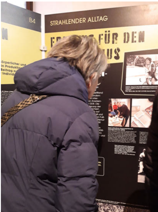
Bild 3: Das Interesse für die Ausstellung „Gesichter der Wismut“ in Posterstein ist groß.

In Projekttagen und Rechercheausflügen stießen Jugendliche auf Brigadetagebücher, Urlaubsfotos, Restaurant-Karten, Propaganda, Punk-Songs, vermeintlich unberührte Natur und Zeugnisse alter Freundschaften. All diese Gegenstände und Erzählungen entsprangen einem Knotenpunkt: der Wismut.