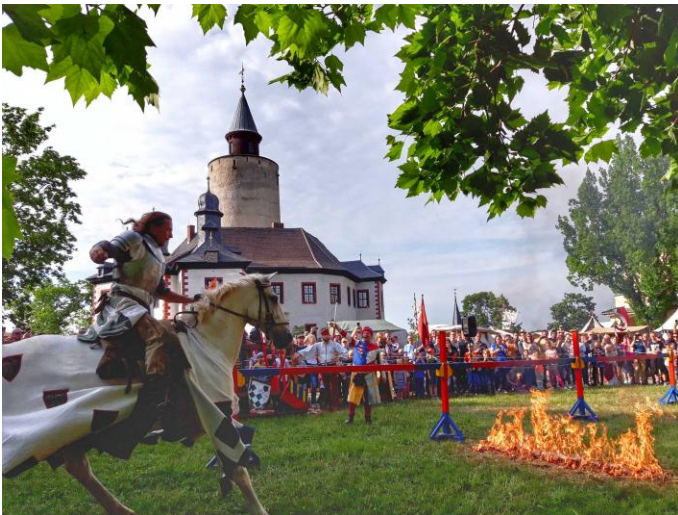
Foto: Der Höhepunkt des Mittelalterspektakels sind die Ritterturniere mit „Wenzels Ritterschaft“

Zum dreitägigen Mittelalterspektakel von 23. bis 25. Mai 2026, jeweils ab 11 Uhr, auf Burg Posterstein gibt es Ritterturniere direkt vor der über 800 Jahre alten Burg. Ritter, Händler, Handwerker, Gaukler und Musiker lassen an Pfingstsonntag, -sonntag und -montag das Mittelalter aufleben – mit tausenden Schaulustigen als Publikum.