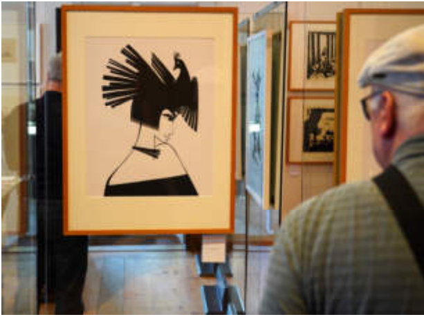
Foto: Besucher in der Sonderschau mit Scherenschnitt von Luise Neupert

Weitere hochauflösende Bilder zur Ausstellung finden Sie in unserer Dropbox (Ordner: Ausstellung Luise Neupert) zum Download: (Klick rechts oben auf „Herunterladen“)