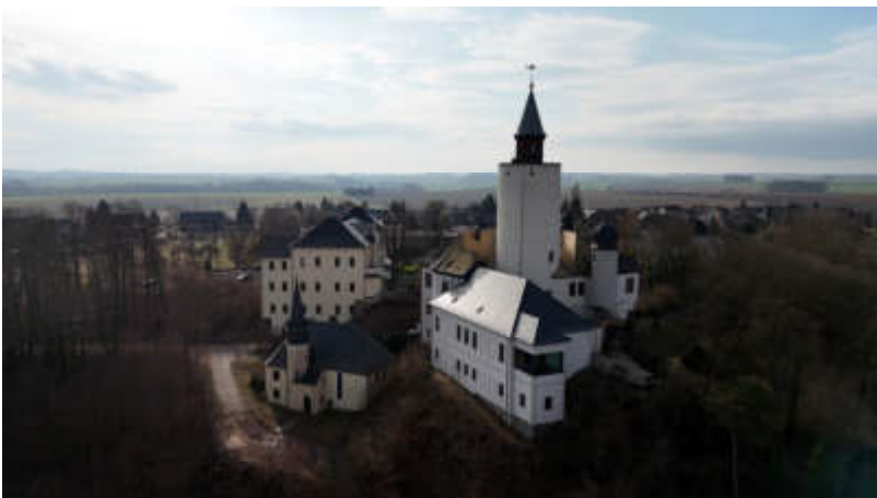
Foto: Drohnenaufnahme der Burg Posterstein mit Nordflügel-Neubau

Zum International Museumstag lädt das Museum Burg Posterstein um 11 Uhr zu einer exklusiven Führung über die Baustelle des neuen Nordflügels der Burg ein. Hier informieren wir Sie über den aktuellen Stand der weiteren Bauarbeiten.