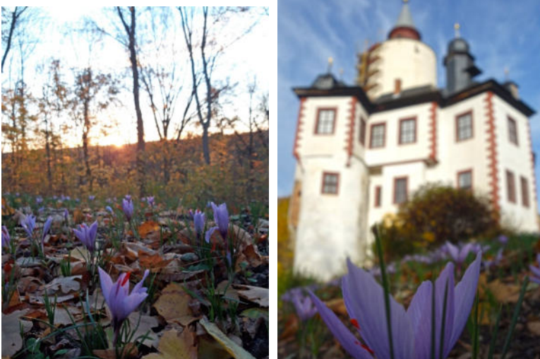
Bilder: Erste Safran-Blüten

Für die Einwohner Postersteins geht damit ein lang ersehnter Traum in Erfüllung: Der ehemalige Wehrgraben unterhalb der Burg erstrahlt in lila Glanz. Finanziert im Rahmen der Safran-Kampagne des Altenburger Landes wurde das rund 50 Quadratmeter große Areal im September durch die Firma David Jähler Garten- und Landschaftsgestaltung fachmännisch vorbereitet. Ehrenamtliche des Museumsvereins Burg Posterstein pflanzten dann tausende Safranknollen, die nun allmählich lila erblühen.