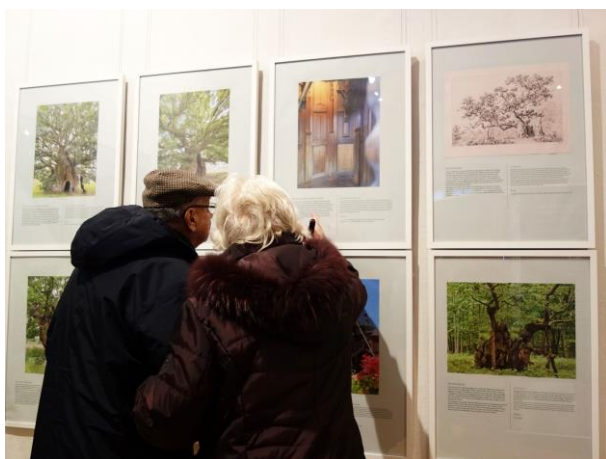
Bild: Besucher in der Ausstellung im Museum Burg Posterstein.