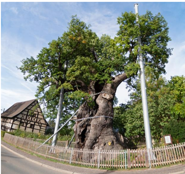
BU: Die 1000-jährige Eiche Nöbdenitz.

Die 1000-jährige Eiche von Nöbdenitz ist nicht nur ein beeindruckendes Naturdenkmal, sondern der einzige bekannte Baum Deutschlands, in dem sich eine Grabstätte befindet. Seit 1824 birgt sie die letzte Ruhestätte des Sachsen-Gotha-Altenburgischen Ministers Hans Wilhelm von Thümmel. Seit mehr als hundert Jahren heißt sie im Volksmund „Die Tausendjährige“. Die Schätzungen über das Alter des Baumes gehen weit auseinander und reichen von 600 bis 1200 Jahren.