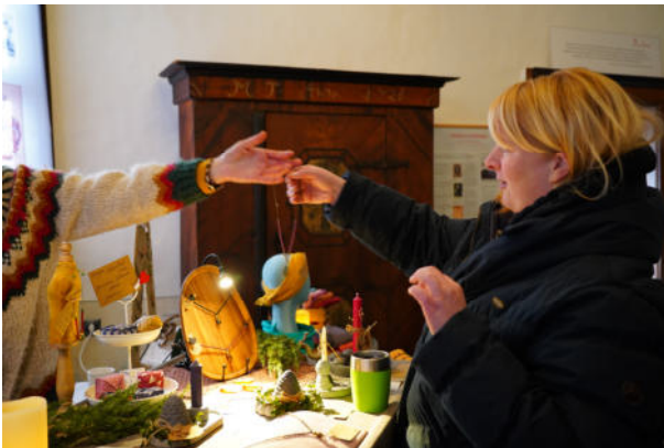
Bild: Advent im Salon am dritten Advent in der ganzen Burg Posterstein.

In stimmungsvoller Atmosphäre gibt es in der gesamten Burg Posterstein geschmackvolle Kleinigkeiten zur Weihnachtszeit. Dazu Märchen, Musik, Unterhaltung und Leckereien aus Küche und Backstube für die ganze Familie. Beim gemeinsamen Weihnachtsbasteln, bei leckerem Gebäck und Heißgetränken kommt man ins Gespräch.