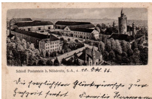
Die Postkarte aus der Sammlung des Museums Burg Posterstein zeigt das Rittergut Posterstein vor der Bodenreform. Die Karte ist vom 10. Oktober 1926.