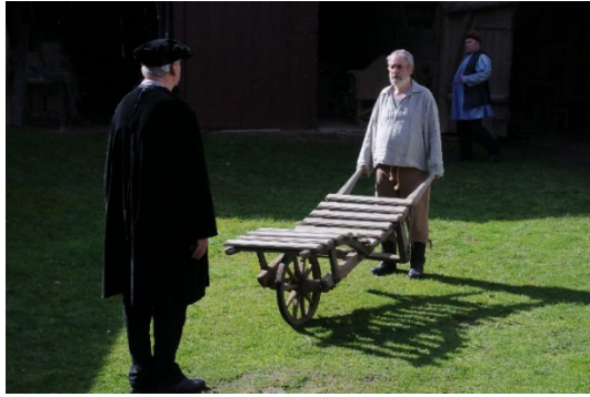
Bild: Filmdreh mit Darstellern vom Traditionsvereins Altenburger Prinzenraub e.V. auf einem Postersteiner Bauernhof

Seit 1528 gibt es Postersteiner Gerichtsbücher. Sie verraten viel über die Menschen und ihre Zeit. Spannende Fälle passierten nicht jeden Tag in Posterstein. Für die Ausstellung wurden einige ausgewählt und von Laiendarstellern des Traditionsvereins Altenburger Prinzenraub e.V. und der Gefolgschaft zu Posterstein unter Anleitung von Profis nachgespielt. Als kurze Filme werden sie in der Ausstellung zu sehen sein.