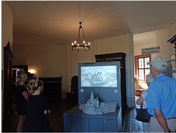
BU: Ein Highlight der neuen Ausstellung: Das Burgmodell und ein Film mit 3D-Rekonstruktionen

„Barbarossa“. Burg Posterstein war Teil eines Netzes aus Verteidigungsanlagen, das die deutschen Siedler im 12. Jahrhundert aufbauten, als sie das Land im Osten, das „Osterland“, für sich beanspruchten. Hier gibt es weitere Informationen zur Burggeschichte.