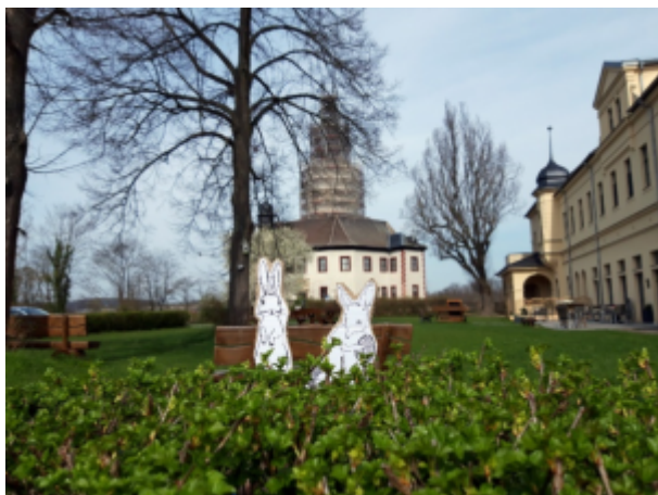
Bild: Im Ferien-Rätsel geht es um Osterbräuche und verschiedene Tiere, die mit dem Osterfest in Verbindung gebracht werden.

„Damit auch die, die noch nicht gut lesen können, mitmachen können, vertone ich die Rätsel-Texte“, erzählt Franziska Huberty. Per QR-Code-Scan können Besucherinnen und Besucher die Texte anhören. Dafür brauchen sie nur ein Smartphone mit QR-Code-Scanner dabeizuhaben.