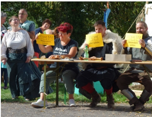
Die Jury vergibt eine gute Wertung

Die Ritter der Gefolgschaft zu Posterstein stehen den Kindern bei ihrem großen Auftritt zur Seite. Mit ihrem Steckenpferd absolvieren sie einen kleinen Parcours auf dem Turnierplatz vor der Burg, bei dem es um Tempo und Geschicklichkeit geht. Unterteilt wird in zwei Altersgruppen: bis 6 Jahre und über 6 Jahre. Das Wichtigste: Bei diesem Turnier gibt es nur Gewinner!