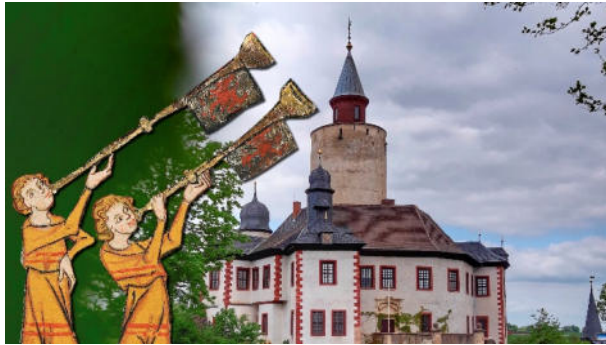
Bild: Musik in der Geschichte – darum geht es diesmal spielerisch und interaktiv im Sommer-Rätsel.

28. Juni bis 10. August 2025, zu den Öffnungszeiten des Museums