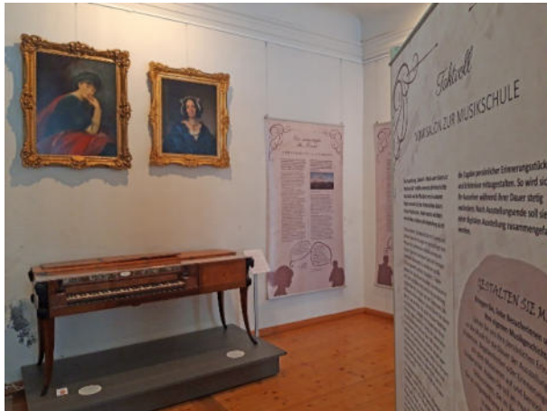
Bild: Die Ausstellung „Taktvoll“ wartet mit beeindruckenden Exponaten und multimedialen Inhalten auf.

Die Sonderschau „Taktvoll“ erzählt in einem Raum die Geschichte der Musik und des Musiklernens von der Zeit der historischen Salons bis ins Heute. Angefangen von der Kirchenmusik und der Musikausbildung in den Salons um 1800 thematisiert die Kabinett-Ausstellung auch die Gründung von Musik- und Gesangsvereinen bis hin zu den Musikschulen. Was bedeutet Musik für den Einzelnen und für die Gesellschaft? Die Meinungen und Inhalte aus mehreren Zeitzeugen-Salons, die im Rahmen des Trafo-Programms „Der Fliegende Salon“ stattfanden, sind in die Sonderschau eingeflossen und machen sie lebendig.