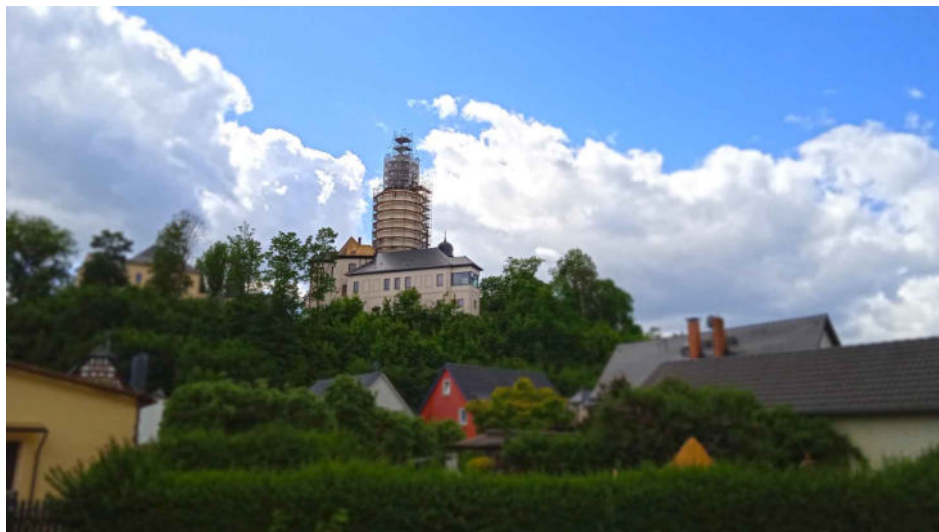
Bild: Der Rohbau des neuen Nordflügels der Burg Posterstein ist fertig. Im August findet ein Jazzkonzert auf der Baustelle statt.

Im Folgenden sende ich Ihnen ausführliche Informationen zu den einzelnen Veranstaltungen.